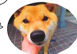
お客様の愛犬 まるちゃん